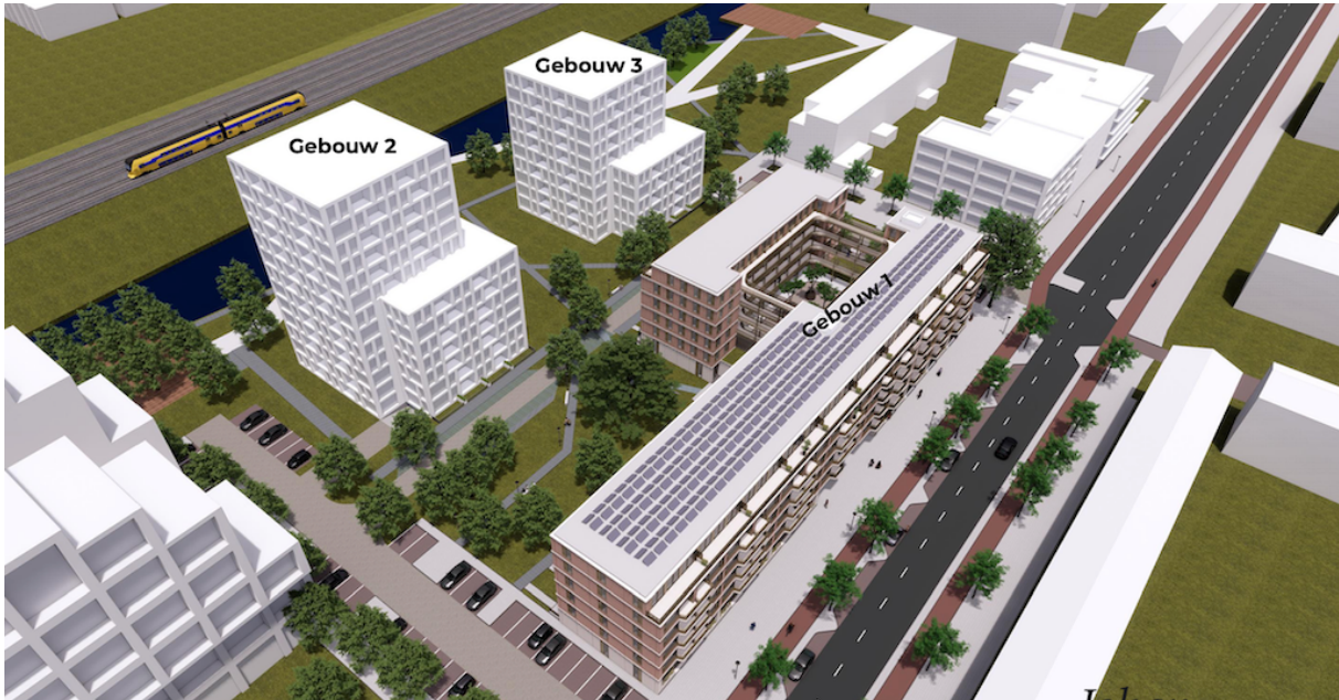
Vogelvlucht impressie vanaf de postjesweg